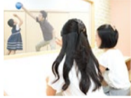
保護者はマジックミラー越しに、子どもの様子を見ることが出来る。終了後、指導員との振り返りで次回につなげていく。