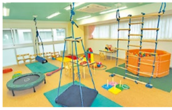
感覚調整遊具はバランス感覚を養うブランコから、触覚に働きかけボディイメージを高めるボールプールなど多彩。楽しみながらプログラムに取り組める。