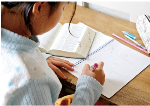
小学校でも英語の授業が始まることでテストも実施され、評価(成績)が付けられることになる。苦手意識を持つ前に、「英語って楽しい!」、「英語が話せるようになって、外国のお友達とお話したい!」と、子どもたちに前向きに英語学習に取り組んでもらえる環境を作り出すことが大切になってくる。