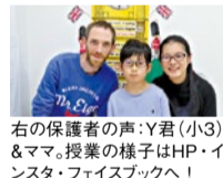
右の保護者の声:Y君(小3) & ママ。授業の様子はHP・インスタ・フェイスブックへ!