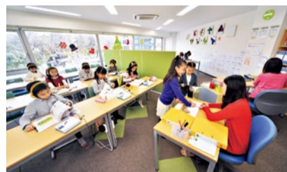
「できた!」の喜びが体験でき、子どもの好奇心を引き出す

説明会&無料体験開催 2/1(金)～3/30(土)毎日開催 ※日・祝除く 平日は16時～17時。土曜は10時～13時。各回1時間程度。申込は電話にて。