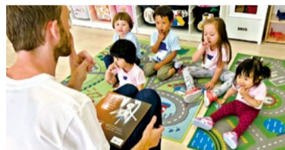
ギャビン先生は自身も2人のお子さんのパパ。子どもの扱いを熟知していて、生徒はみんな先生が大好き!