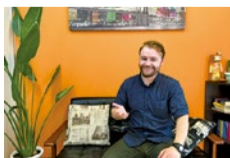
ネイティブだけでなく、日本人に英語を教えてきた経験も豊富。

安心のレッスン料も人気のヒミツ。費用は入会金と月謝のみで、年会費・設備費は無料、テキスト購入費もいらず、経済的に習える!