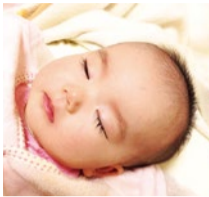
数多くの妊娠実績あり。喜びの声など、詳しくはHPで。

煎じ薬、粉薬の調合も行う北摂でも数少ない漢方専門薬局。子宝相談は評判で同店の得意分野。とりわけ内膜や卵の質の分野では噂を聞き、東海や関東からも来局される。高齢の方も多く、妊娠した3人に1人が40代という。細かく時期や体調を見ながら、「今」必要な漢方で体を整えていく。精子数、運動率の改善実績も豊富で、自然での妊娠を希望されている方にも心強い。