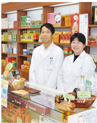
この写真の雰囲気の通り、やさしく相談しやすい人柄。国際中医専門員の資格を持ち、これまでの経験や豊富な知識から的確に体質改善へ導いてくれる。不妊症、アトピー、自律神経失調症など不調を感じたら相談してみよう。