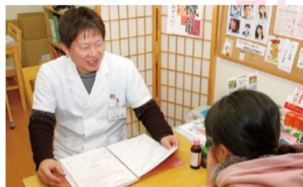
漢方の専門用語はなるべく使わず、わかり易く説明してくれる。