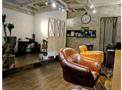
落ち着いた空間の店内。外からも見えづらくなっているので、視線も気にならずリラックスできる。

魅力を最大限に引き出すプライベートサロン 完全予約制のプライベートサロン「LICO」。カウンセリングから仕上げまでマンツーマンなので、ゆったり落ち着いて過ごせる。人気の秘密はスタイリストの人柄と高い技術力。「スタイルのデザイン力が高く、伸びてきてもまとまる」と紹介で訪れるゲストが多い。薬剤も髪や肌にやさしいものを取り揃えている。ヘッドスパもおすすめで、オールハンドで至福のひとつときを。