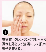
1 施術前、クレンジングでしっかり汚れを落とし清潔にして肌の調子を整える。

造顔マッサージ® (30分) シティライフ限定価格 3,240円 (2月未まで) フェイスラインがスッキリ、目はパッチリ、鼻立ちがクッキリと肌質改善&小顔に導く大満足の30分。ストレスや肩・首のこり、目やあごの疲れも同時に和らぐのが魅力!