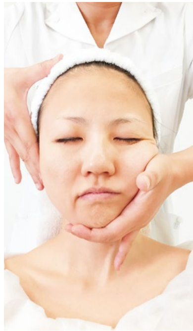
お手入れがスピーディなところも高い支持を得ている理由。高水準の技術力で若々しく!大好評につき、1ヶ月前の予約がオススメ。

この季節は、寒さによる血行不良がたるみやむくみを加速させがち。乾燥のせいで目立つしわも、造顔マッサージ®で、ひとまとめに改善しては?このお手入れは世界的に有名な田中有久子先生が開発し、グランモアはその正規継承サロン。たった30分であるが、むくみ・しわ・ほうれい線などの老け要因がスッキリ、小顔&若返りも叶えてくれると、メディアでも圧倒的な人気!お手入れのカギは、老廃物が溜まりやすい目の周りや小鼻の横、頬骨付近を中心に皮膚表面だけでなく筋肉にまで働きかけ、血流やリンパを促す独自の手法。顔の筋肉は、ストレッチや首・肩のこり、噛みグセなどで硬くなり、血流やリンパが滞ってたるみ・むくみの原因に。冷えて血行が悪くなると、さらなるダメージ。そこで、オールハンドで「イタ気持ちいい」圧を加え、顔に溜った老廃物や脂肪を押し流し。座ってお手入れをするため、血流が3倍アップして、フェイスラインの引きしめ効果も高まる。春に向けて、輝く小顔美人を目指してみよう。