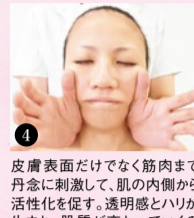
3 皮膚表面だけでなく筋肉まで丹念に刺激して、肌の内側から活性化を促す。透明感とハリが生まれ、肌質が変わっていくのを体感。