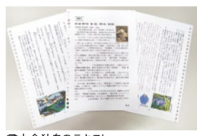
帯木会独自のテキスト

必要はありません。楽しく聴いていただければ充分です」と話す。受講生からは、「恐る恐る体験に参加したら、いい雰囲気だったの。大きな字でイラストや写真満載のオリジナルテキストが分かりやすいと好評だ。また、希望者対象に、京都などの名所散策、芸術鑑賞・文楽・落語映画ほか、食事会などの行事も実施（要実費）。それらを通して、同じ趣味ならでは、かけがいのない友人ができたと言っている。村田先生は「講座の内容を無理に暗記する