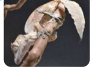
枯れた葉のような体で、特に尾は木の葉にそっくり!