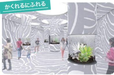
タテジマキンチャクダイの幼魚がモチーフとなっている空間デザイン。成魚と大きく模様や体色が異なるのは、成魚の縄張り争いに巻き込まれないためと考えられています。