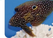
全身の白い斑点と、背ビレの後半にある大きな目玉のような模様で、ハナビラウツボなどの大型のウツボに擬態。