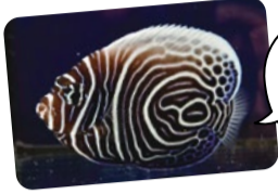
もちろんタテジマキンチャクダイの幼魚も展示!

新たなゾーン「かくれるにふれる」では、姿かたちが木の枝や葉にそっくりになることで、周囲の環境に溶け込んでかくれるものや、毒を持つ生きものに見た目も行動も似せ