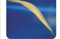
最も長い和名を持つ魚。細長く平らな体でアマモなどの海藻に擬態。