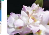
ランの花に擬態し、花にまぎれて待ち伏せしたり、花の代わりとなって獲物をおびき寄せて捕獲する。