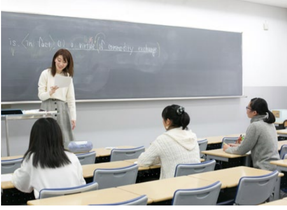
河合塾では1つの授業で「英語4技能」を統合的に伸ばすことを重要視している。他の生徒との解答の共有やペアワークを行うことでより理解を深めていく。