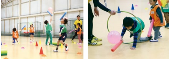
(上) 大小のボールを使って、的に向かって投げたり、蹴ったり、打ったりする「的当て競争」は基本動作を高める。(下) 「スティックで風船上げ」も簡単な動作だが、①スティックを掴む②風船の落下点を予測する③落ちてきた風船を打つという3つのアクションを同時に感覚運動だ。