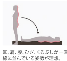
耳、肩、腰、ひざ、くるぶしが一直線に並んでいる姿勢が理想。

「肩こりや頭痛の原因は「合わないまくら」かも」(要予約)詳しくはP9の関連記事もチェックを。