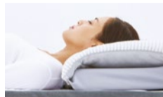
まくらが高すぎると、頸椎が前に曲がることで気道が狭くなり、いびきの悪化や低酸素状態を生じやすくなるそう。