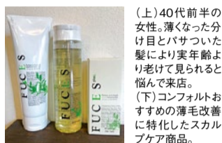
(上)40代前半の女性。薄くなった分け目とバサついた髪により実年齢より老けて見られると悩んで来店。 (下)コンフォルトおすすめの薄毛改善に特化したスカルプケア商品。

自分では気づきにくい後頭部のつむじ周り。意外に見られているって知ってた? 女性の場合は特に顔周りより、つむじ周りから薄毛が始まるケースが多いそう。後姿でプラス10歳なんてならないように定期的にケアしよう! すでに薄毛が始まっている人でも大丈夫。コンフォルトのスカルプケアならそんな悩みも一掃できる! ぜひ試してみてください。