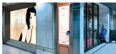
(上)オーガニックと言っても、明るめからしっかり深めな色まで幅広く毛染めができるので、好きな色を選んでみて! (下)西宮北口駅直結の好立地。広々とした店内は、セット面が12席並ぶ。

特典 「シティライフを見た」で、 ●技術料50%OFF! ●カット4,104円→2,052円 ●オーガニックカラー.....7,020円~→3,510円~ その他、全メニューに対応! ※縮毛矯正・ヘッドスパ・アップ・学割など一部対象外あり。(3月末まで、新規のみ、他券併用不可)