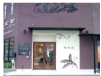
(上)40代以上の女性スタイリストが多く在籍。豊富な経験をもとにどんな髪の悩みにも応えてくれる。(左)171号線沿いにある便利な立地。キッズスペースがあるのでお子さまと一緒にでも安心!

特典 「シティライフを見た」で、 ●技術料30%OFF! ●カット.....2,700円→1,890円 ●カラー.....4,860円→3,402円~ その他、全メニューに対応! ※セルフブローカラー、縮毛矯正など一部対象外あり。 ●ホームケアトリートメント(1,080円)をプレゼント! (3月末まで、新規のみ、他券併用不可)