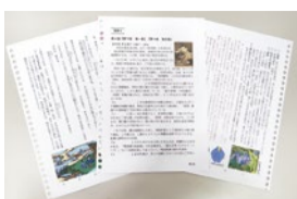
帯木会独自のテキスト