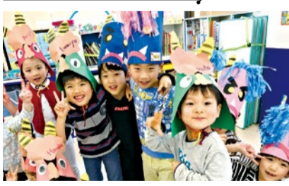
7時半~19時保育もOK! イベントも充実で生徒の笑顔溢れる教室。

【保護者の声】 体験会に参加した時に、年長さんたちがうちの子のお世話をしてくれました。園長先生は「これが普通になるから」とおっしゃっています。うちは一人っ子なので小さい子にも優しくできるようになればと思い、その日に入学を決めました。(吹田市・Wさん)