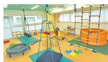
感覚調整遊具はバランス感覚を養うブランコなど多数取り揃えている。