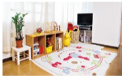
お子さまのお預かり、お食事もOK!

施術は始まりから終わりまでムダがなく、充実感を感じます。3ヵ月間採寸して結果も一目瞭然でした。体重54.1kg→50.0kg(-4.1kg) ウエスト74.0cm→66.8cm(-7.2cm)