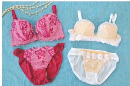
(左)上下セット4,752円 (右)上下セット3,132円

日々の暮らしの積み重ねが原因で、カラダが疲れて太りやすくなったり、ボディラインが崩れたりしていませんか。食べるものを見直したり、体形をサポートしてくれる頼もしい二人に頼って、健康で美しい生活をはじめましょう。