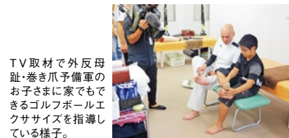
TV取材で外反母趾・巻き爪予備軍のお子さまに家でもできるゴルフボールエクササイズを指導している様子。

1度目の施術で痛みを解放を感じる人がほとんど 大阪初「イベントプラス療法」は認定講師のみが行える特許施術。その特徴は矯正力が高く、重度な巻き爪も改善でき、再発しにくいこと。他の施術方法ではダメだった人も来院しており、速くは大部分から通う人もいます。