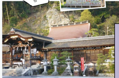
京都最古の神社 松尾大社

太古この地方に住んでいた住民が、松尾山の 神霊を祀って守護神としたのが起源とされており、 渡来人・秦氏がこの地に移住して松尾の神 を一族の総氏神と仰いだ。「松尾造り」といわれ る特殊な造りで重要文化財に指定されている。