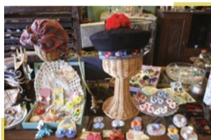
アンティーク雑貨店 Sutekki (ステッキ)

京都市西京区松尾万石町53 営/10時～16時 ☎075-381-4461 https://yunotaya.owst.jp/