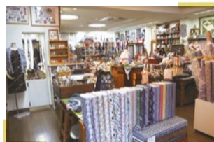
リバティプリントショップ トランテアン

京都市西京区松尾大町20-36 営/12時～19 時 月曜・第2日曜・第4火曜定休 ☎075-874-2705 https://sutekki-kyoto.com/