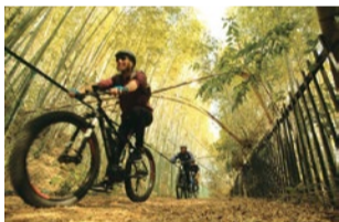
スポーツサイクルライドイベント

サイクルベースあさひ洛西口店では、E-スポーツサイ クル(レンタル可)で、自然豊かな洛西をサイクリングす るガイド付きツアーなどのイベントを定期的に開催し ている。5月1日(水祝)には「洛西名物タケノコ掘り体 験ツアー」も予定。イベント詳細や申し込みはwebにて。