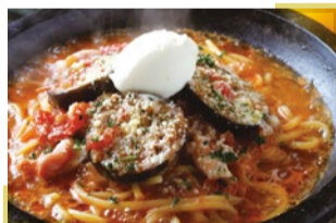
古民家でいただく 石焼生パスタ 蔵之助

京都市西京区松尾木ノ曾町51-6 営/10時～18 時 日曜・祝日定休、不定休あり ☎075-392- 8119 https://www.trentetun.com/