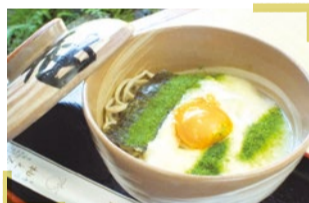
名物とろろそば「苔の月」 柚之茶屋 (ゆのちや)

京都市西京区大原野小塩町1372 入山時間/8時 ～17時(16時45分受付終了) 入山料/大人500 円、高校生300円、小・中学生200円 ☎075-331-0020 http://www.yoshiminedera.com/