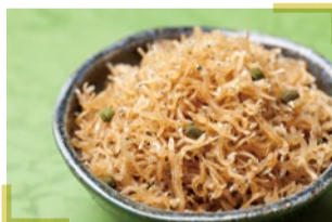
京の伝統の味 京の佃煮 京と桂

京都市西京区榎原宇治井町26 営/11時～15時 (L.O.14時)、18時～22時(L.O.21時) 不定休 ☎075-925-8734 https://www.ishiyaki-namapastakuranosuke.com/