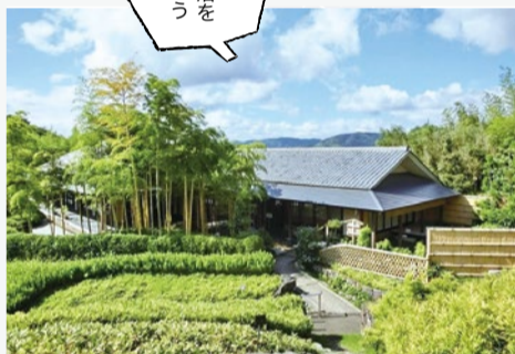
世界的にも 名高い竹林公園 京都市洛西 竹林公園

全国各地から多くの竹類が植栽された回遊式和風 庭園。遊歩道を散策しながら竹や笹の生態を観察したり、 「竹の資料館」で学ぶことができる。また、子どもたちが 竹林のなかでのびのびと遊べる「こどもの広場」も。