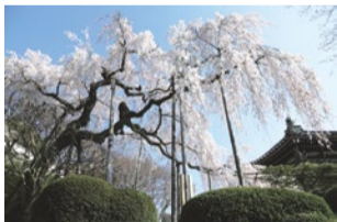
桜の名スポット 善峯寺

京都市西京区川島六ノ坪町29-2 ☎075-382-2131 https://asahi.resv.jp/