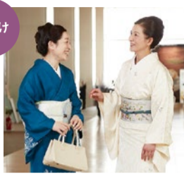
着付けを学んできれいに变身!

「キレイに着物が着たいけど、私には難しいかな」そんな不安をお持ちの方は、まずは着物に触れてみませんか? 着物専門校の京都きもの学院は経験豊富な講師たちがきめ細やかに教えてくれるので、着物が初めての方や以前習っていたけれど忘れてしまったという方も安心。手結びを中心とした着付けで簡単に着ることができ、洋服感覚で気軽におしゃれを楽しめる。教室は、ヒルトン大阪や高槻など約80教室もあり、いずれも駅チカ。練習用の着物や名古屋帯は無料レンタルがあり手ぶらで楽々。振替受講も無料で、授業内で着物の販売が無く安心だ。