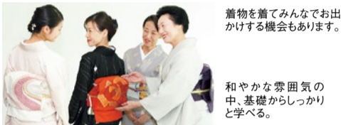
着物を着てみんなで出かけする機会もあります。