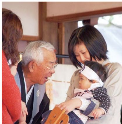
地元高槻の野見神社で、子どもの成長祈願をしてみよう。

4/29(月・祝)、高槻市にある野見神社にて開催される「奉納泣き相撲」。子どもを授かったことに感謝し、ご神前で大きな声で泣くことにより、子どもの健康と成長を祈願する神事として、古来より日本各地で行われてきた。只今、この「泣き相撲」への参加者を随時募集中。当日は、本殿での御祈禱(約15分)の後、泣き相撲を開始。取り組み終了までは約1時間ほど。赤ちゃんは上半身裸で腹掛けとはちまき姿(体調などにより肌着の着用も可)で取り組みを行う。保護者の方は平服でもOKだ。当日は、四股名(しこな)で取り組みを行うので、○○富士や○○姫など、お好きな名前を考えて、参加してみよう!