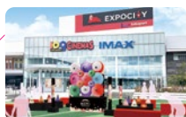
▲「和」の美が詰まった番傘モニュメント