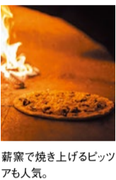
薪窯で焼き上げるピッツアも人気。

肉をステーキやハンバーグで味わえるお店だが、4月からは新たにアワビなどの魚介をつかったメニューが登場する。贅沢に生食用の新鮮なアワビを味わうカルパッチョと、アワビ海老・メバル等の魚介のグリルの2品だ。どちらも産地直送の新鮮野菜で作られた15種類以上のサラダや手作り総菜が食べ放題なので満足度も高い。