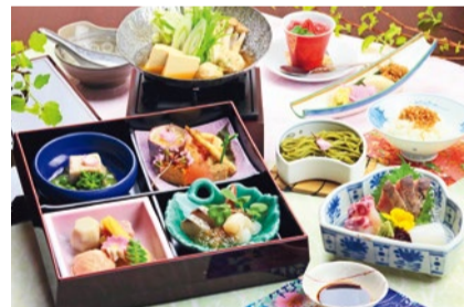
季節の食材を使った春の川床会席料理 ※写真はイメージ

特典 「シティライフを見た」で 新元号お祝い乾杯特典 お一人さまにつき ワンドリンクプレゼント(ワインまたはソフトドリンク) ※6名様まで、4月末までの予約、6/9まで利用可能。