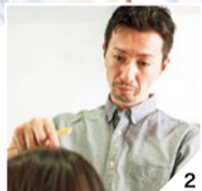
1.「この髪型にしてほしい」と予約が多い。 2.マンツーマンサロンだから悩みを伝えやすく、丁寧に仕上げられる。

初回の方限定 Special Menu カット+カラー+トリートメント 7,000円 今回は長さの変動なし(4月末まで)