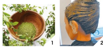
1.厳しい成分検査証明のある有機栽培ヘナを使用。 2.ヘナは重ねる程まとまりと艶を増し薄毛予防にも。

「化学染料入ヘナやカラー剤をずっと続けているけど、痒み・薄毛・乾燥毛に悩んでいる」という方、カラーを続けていくことに髪や頭皮、身体への負担など疑問を感じている方にオススメ。同店ではヘナ協会認定講師と毛髪診断士が在籍。「有機栽培薬草ヘナ」で年中白髪知らず&薄毛予防&艶美髪に導く。全国(京都、滋賀、広島、東京など)からも同店の施術を求めて訪れる人がいるという。また調理師・電磁波測定士のセラピー美容師が衣食住からも健康美を提案してくれる。