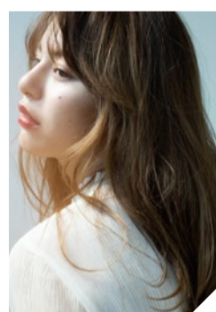
駅直結だから雨でも濡れずに行けて便利!近くの病院や買い物、会社帰りなど幅広い世代がリピーターに。確かな技術で貴女の魅力を引き出してくれる。