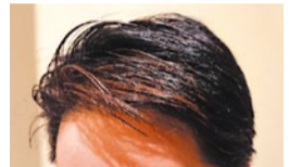
店主が理美容師なので、男性客も多数。ヘナ染も大変好評。