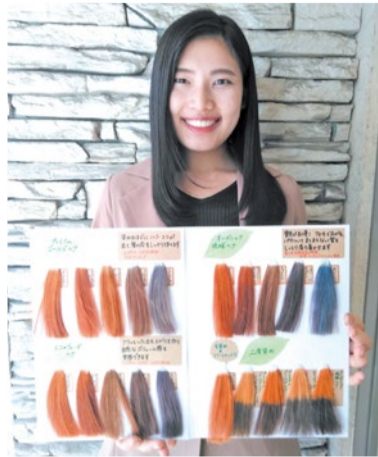
天然ヘナで薄毛予防+艶髪+白髪知らず!ヘナでも幅広い色味が可能、綺麗なブラウン系も好評。