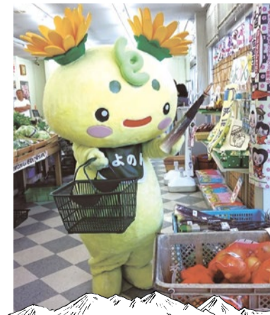
農家直送の新鮮野菜がずらり。ワラビ、タラの芽、ふき、花山椒、原木椎茸など春の野菜も登場。