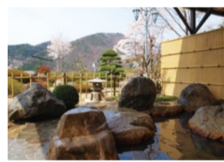
上)春爛漫の天然温泉で疲れを癒やして。 左)春の特別会席:天然鯛のしゃぶしゃぶに鮎の3種食べ比べ。黒毛和牛の鉄板焼きもついてお得!