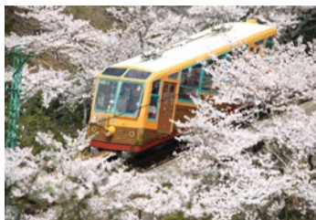
上)一万年以上前から残る、天然記念物のブナ林。 下)春は左右一面に桜を見ながら妙見山へケーブルカーで上がることができる。