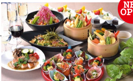
女子会コース 2,980円(メインの鶏肉料理をローストビーフに変更する場合+500円、予約は14時以降)

北摂では珍しい、国立循環器病研究センター認定の健康メニュー「かるしお定食」が食べられる同店。低カロリー&減塩なのに、ボリュームもしっかりあると大好評!全定食に健康サラダがついているのも嬉しい。カフェタイムはコーヒーお替り自由なのでゆっくりくつろげる。