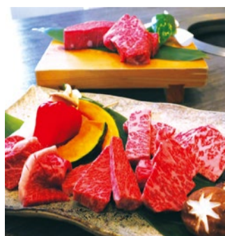
左)凍(りん)2,200円(税別) 上コース、上カルビ、上ハラミ、焼き野菜、ドリンク ※ランチのみ、ランチは1,500円(税別)～

岡山県瀬戸地区で肥育された「備前和牛」の雌牛を中心に長期肥育した味の濃い牛肉を提供。赤身とサシのバランスが絶妙で食べやすく、独自ルート仕入れで、上質なのにリーズナブルな価格を実現している。ご飯は魚沼産コシヒカリを使用するなど、食材へのこだわりは強い。