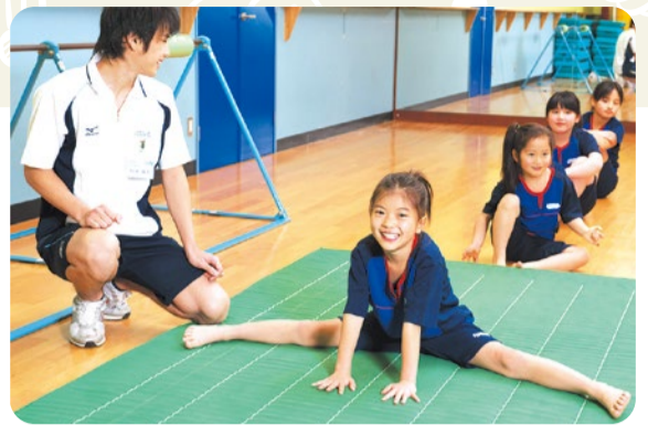
複数の種目を習うメリットは、「友だちが増える」「多様なスポーツを体験できて、楽しさがアップする」など、コーディネーション能力の向上以外にも多数!

また、同クラブでは子どもの運動能力を引き出すとともに、心身の健康を総合的にサポート。礼儀作法やマナーなど社会性の習得、イベントやサークル活動といった集団行動を通しての自主性、積極性の醸成など、豊かな人間性を育てられる。その他、フットサル・テニススクール受講の場合「複数受講540円割」適用OK。スクールパスも運行中で便利!