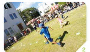
1.「手の振り方はきゅうりをすばやくトントンと切るように」など具体的で子どもたちも分かりやすい。 2. 歩幅を広くするための黄色いラダーを置いての練習。歩幅が広がることでタイムが速くなる。