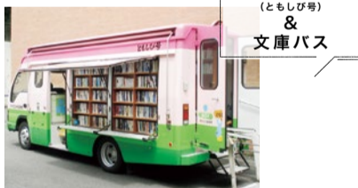
移動図書館 (ともじび号) & 文庫バス