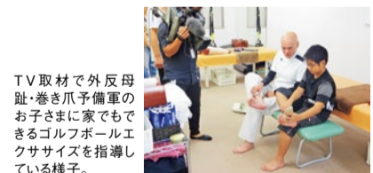
TV取材で外反母趾・巻き爪予備軍のお子さまに家でもできるゴルフボールエクササイズを指導している様子。