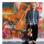
9th Album 「Polyvalent」 (ポリバレンタ)

高槻はヴァイオリニストを多数輩出しているめずらしい地域なんです。高槻出身で頑張っている僕の姿を「高槻ジャズストリート」などに見に来ていただき、北摂感を共有できれば。高槻にもどろんどろん帰ってきたいです!