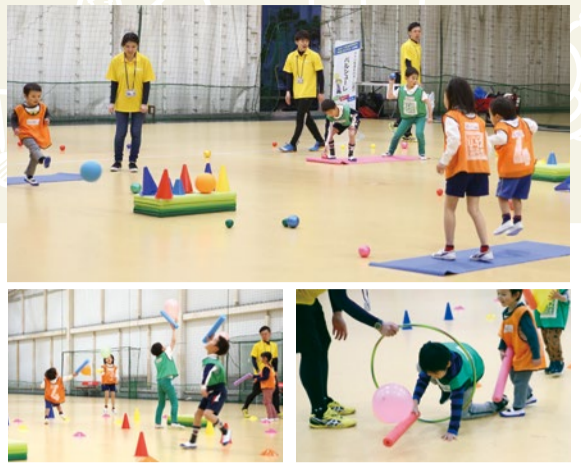
(上) 大小のボールを使って、的に向かって投げたり、蹴ったり、打ったりする「的当て競争」は基本動作を高める。(下) 「スティックで風船上げ」も簡単な動作だが、①スティックを握む②風船の落下点を予測する③落ちてきた風船を打つという3つのアクションを同時に行う感覚運動だ。

野球やサッカーといった専門性の高い動きを始める前にやっておくと、運動能力の土台になる。まずは、読者特典で参加費が無料になる体験会でその魅力、楽しさにふれてみよう。