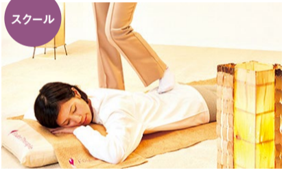
「本当に足!？」と思わず振り返りたくなる技術。

フーセラピー無料体験会 【日程】5/16(木)・17(金)・18(土)・ 6/20(木)・21(金)・22(土)・23(日) 【時間】10時~13時、16時~19時(各2時間) ※完全予約・定員制(先着順) ※スクールはいつでも入校可