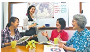
上)先生は全員ネイティブのアメリカ人専任講師。フレンドリーかつ丁寧に教えてくれ、なまじり標準的な英語表現を学べる。うまくリードして一人ひとりに話をふってくださるので安心! 左)レッスンは「間違えてもOK」なアットホームな雰囲気だから、初心者でも臆することなくどんどん発言できる。

日本語を使ってもOKな「超初心者クラス」や、少しずつ英語に慣れてチャレンジできる「初級クラス」が人気。ABCから復習したい、簡単なあいさつにも自信がない、基本的な文法からやり直したいという人でも安心して受けられる。