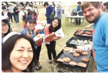
春はイベントやクラス外での交流も多い。実際に英語を使いながらアメリカ人の先生達と楽しい時間を過ごせる。

初心者でも同レベルの仲間と楽しみながら上達 ネイティブ講師から標準的なアメリカ英語を学ぼう あわただしい年度は じめが落ち着き、5月 は英語をはじめるとは 最適な季節。「エンジョ イ・イングリッシュ」がモ ットーの同スクールで は、レッスン時間を90分 と長く取っており、たく さん話せるので実践的 な英語がぐんぐん身に つく。自己流の表現も きちんと直してくれ、 毎回「なるほど」と発 見が多いそう。クラス 数は初心者から上級 者まで100近くある ので、自分と同レベルの 仲間と励まし合いなが ら学べる。話題が尽き ないから飽きず、他の 人の話を通して世界が 広がり、英語のポキャブ ラリーが増やせること が少人数グループレッ スンの魅力。忙しくて も振替は電話1本で 大丈夫だから無駄なく 通える。会費もお得な ので、続けやすいことも 魅力だ。無料体験レッ スンも随時受付中！