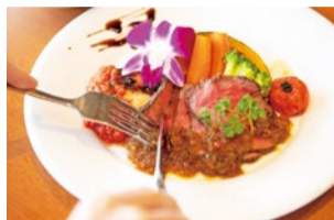
三田和牛のローストビーフは、スッとナイフを入れただけで切れるほどやわらかい。

の青いケシだ。中国南部からヒマラヤにかけての高山地帯にしか咲かない花で、屋外で鑑賞できるのは西日本ではこの植物園だけ。植物園のスタッフがガイドしてくれるので、解説を聞きながらじっくりと観察できる。エリア内の通路スペースは、青いケシの大群落の中を進めるようになっている。おすすめの撮影スポットとなっている。