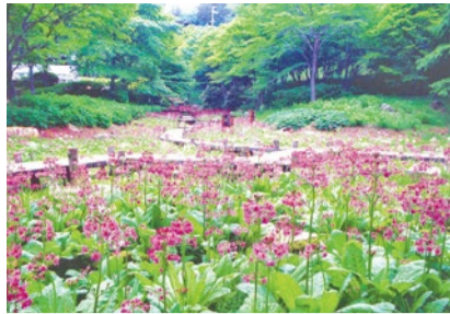
上/四季折々の植物を自然に近い状態で栽培。ツアー期間中は青いケシのほか、5月中はクリソウの群落(写真)なども見ごろに。右/植物園では感染手ぬぐい専門店「にじゆら」とコラボした手ぬぐいを販売。通常1,620円のところツアー参加者は1,000円で購入できる。