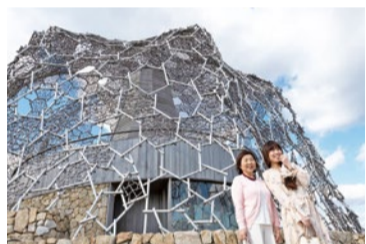
展望台は建築家の三分一博志氏が設計。

自然体感展望台 六甲枝垂れも必見 ランチ後に訪れたのが、六甲ガーデンテラス内の「自然体感展望台六甲枝垂れ」。幹のまわりを枝葉(網目状)のフレ