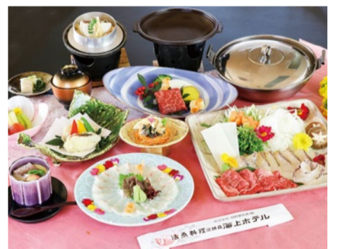
※画像はイメージ。当日の仕入れ状況により内容変更の場合あり。

全室から望めるオーシャンビューが人気の淡路島海上ホテル。この春登場の「春陽会席」プランは、お部屋食でゆっくりとくつろぎながら、桜鯛を中心とした淡路島の豊かな春の味覚が堪能できる。旬を迎えた桜鯛をお造り、みぞれしゃぶしゃぶ、鯛釜飯とバラエティ豊かに味わえて、淡路牛陶板ステーキやアワビ踊り焼又は造りなどオプションお料理が今なら各1,500円(税込)とお得!美肌効果で知られるナトリウム炭酸水素塩泉を満ちた露天風呂と一緒に利用してみたいかがだろうか。