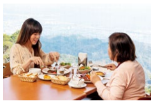
絶景を望みながらの食事に、二人の会話も自然と弾む。

わじ鶏が楽しめる。ジュシーな味わいと、まろやかな甘味が絶妙にマッチし、ボリウムも満点の一品。その他、サラダ、スープ、パケットデザート、ドリンクバーも楽しめる。