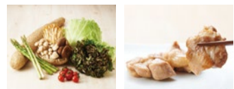
※天候や仕入れにより使用する食材の内容が変わる場合がございます