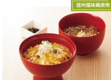
信州福味鶏のチーズ親子丼セット 1,167円

そして5月9日からは「しあわせ信州フェア」がスタート。信州の自然の中で育った信州福味鶏は、肉質がやわらかくジューシーな旨みと特徴。まろやかなチーズと合わせた親子丼でお楽しみください。 また信州天ざるは、戸隠のぶなしめじ、山形村産の長芋など旨みたっぷりの野菜をサクッと仕上げた天ざる。そばとの相性も抜群です。