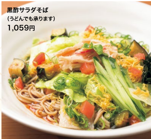
黒酢サラダそば (うどんでも承ります) 1,059円