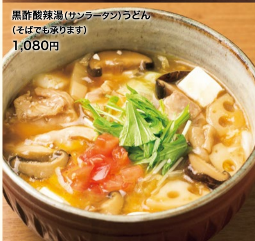
黒酢酸辣湯(サンラータン)うどん (そばでも承ります) 1,080円