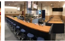
吹田グリーンプレイス店