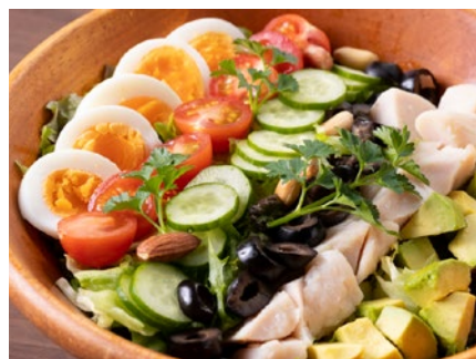
彩り豊かで具だくさんの「サンマハロ コブサラダ」