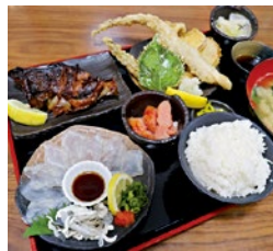
令和の超よばり定食(2,380円)は、トラフグ刺し、銀鱈カマ照り焼き、淡路島産穴子と太刀魚と野菜の天ぷら、あご落とし明太子のラインナップ!