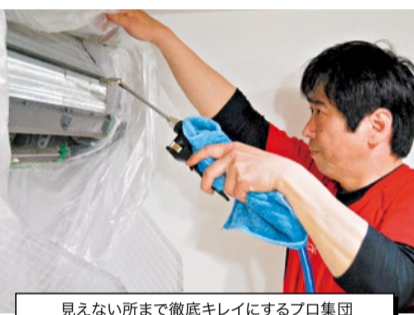
見えない所まで徹底キレイにするプロ集団

高視力用 高槻市芥川町 2-8-20 営/10時~19時 木曜定休 ☎072-682-0149