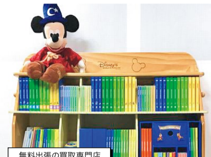
無料出張の買取専門店

information ディズニー英語システムは15年前の教材でもOK! ワールドワイドキッズや七田教材、キュポロやクアドラ、WAKUブロック、スクリーン、ネフなどの木製玩具も買取。