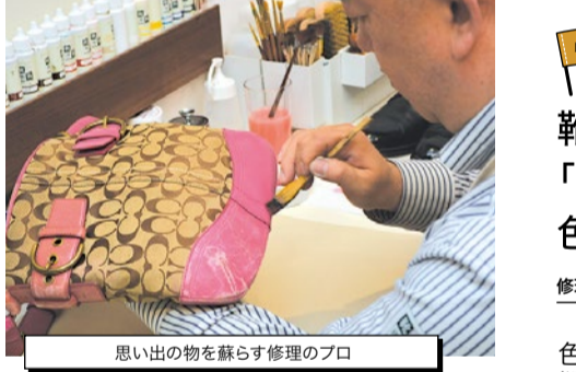
思い出の物を蘇らす修理のプロ

information 靴専科はクリーニングや色補正は殆ど店内で行う。修理してくれる人と直接話せるので細かい相談もできる。