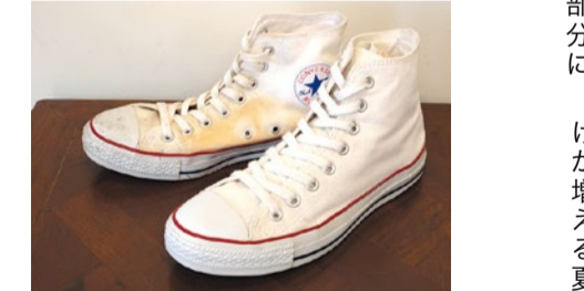
白のスニーカーの左右に大きくついてしまった黄ばみ。同店のクリーニング技術で左足は新品同様の白さに。

information 靴専科はクリーニングや色補正は殆ど店内で行う。修理してくれる人と直接話せるので細かい相談もできる。