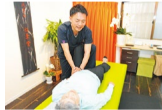
「次の日の体の状態が今までと違う」と効果を実感して次々と紹介のゲストが増えている。

長年向き合っている痛みや違和感がある人は早めの治療を。一旦痛みが治まっても放置していると悪化しがち。そんな腰痛を専門にしている同院は、繋がっている全身の筋肉を調整するから効果てきめん。何をしてもダメだった痛みも改善したと口コミが広がっている。