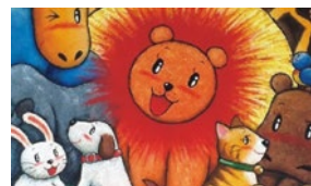
徳治 昭 童画家イラストレーター 宝くじイラストや絵本、キャラクターデザインなどで活躍。

徳治 昭 童画家イラストレーター 宝くじイラストや絵本、キャラクターデザインなどで活躍。 わくわくデンタルグッズ 先着50名様にプレゼント