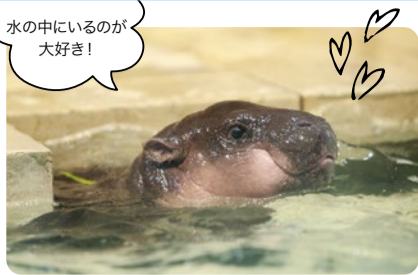
水の中にいるのが大好き!