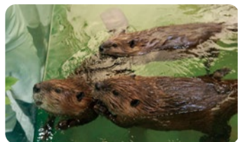
枝葉を持ったキュレーターさんを見つけ「早くください!」と言わんばかりに集まる三つ子たち。

ニフレルでは、生きものの赤ちゃんたちがすくすくと育っています。今回は、赤ちゃんの成長をお届けします。 4月8日にプールのデビューした、2月21日生まれのミニカバの赤ちゃんタムタム。朝はバックヤードから展示ゾーンに出る際、食べるのが好きな母親のフルフルは餌場に行くのに対し、タムタムは真っ先にプールに向かい、泳いだり潜ったり水遊びに夢中。生まれてしばらくはフルフルについてくる際、食べるのが好きな母親のフルフルは餌場に行くのに対し、タムタムは真っ先にプールに向かい、泳いだり潜ったり水遊びに夢中。生まれてしばらくはフルフルについてくる際、食べるのが好きな母親のフルフルは餌場に行くのに対し、タムタムは真っ先にプールに向かい、泳いだり潜ったり水遊びに夢中。