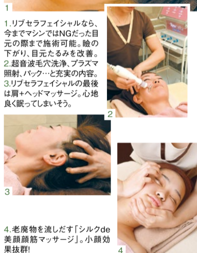
1. リブセラフェイシャルなら、今までマシンではNGだった目元の際まで施術可能。目の下がり、目元たるみを改善。 2. 超音波毛穴洗浄、プラズマ照射、パック…と充実の内容。 3. リブセラフェイシャルの最後は肩+ヘッドマッサージ。心地良く眠ってしまいそう。 4. 老廃物を流した「シルクde美顔顔筋マッサージ」。小顔効果抜群!