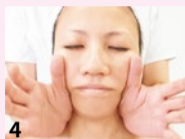
4 皮膚表面ばかりか筋肉をも刺激。肌の内側から活性化させて透明感とハリのある素肌へ!