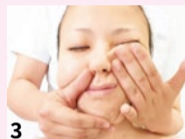
3 圧を加えて、溜った脂肪や老廃物をリンパに流す。「気持ちいい」感覚があるほど、脂肪や老廃物が溜まっている。一回り小さくなったフェイスラインに感謝!

特典 「シティライフを見た」で 造顔マッサージ®体験 初回限定 60分コース … 9,720円 → 4,860円 (シティライフ限定価格) ※造顔マッサージ®とはオールハンドで行う「小顔トリートメント」のことで、(商標登録取得済) ※カード支払可 (要予約・新規の方のみ・6月末まで)