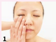
1 施術効果上げるため、クレンジングで汚れを落とし、肌をリセット。

顔の筋肉は、ストレスや首・肩のこり、噛みグセなどで硬くなり、血流やリンパが滞って、たるみやむくみの原因に。「造顔」の正規継承サロンである当店で、数種類のハンドマッサージにより気持ちいい圧を加え、老廃物を静脈やリンパに流し込みます。肩や首のこりもスッキリ! 羨ましがられる小顔美人を目指して、ぜひご体験ください。