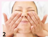
2 座って行うことで、血流やリンパの流れが3倍アップ! 溜まった脂肪や老廃物がほうれい線の原因だとか。