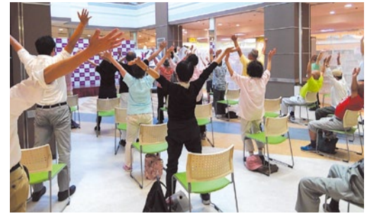
朝8時半から開催している「元氣いばらき体操」の様子。

“地域住民の健康年齢をのばす”をテーマに、イオンスタイル新茨木では多彩な取り組みを行っている。関連商品の提供だけでなく、健康知識のほか、50代後半以降のアクティブシニア「G.G(グランド・ジェネレーション)世代」が集い・交流する場といった環境の提供など、積極的な健康発信基地を目指している。その意欲的な試み取材した。