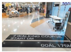
2階ウォーキングコースのスタート地点、コース一周は175mある。