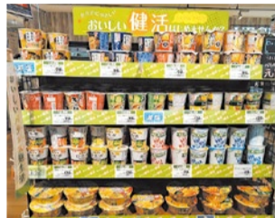
1階食品フロアのロカボ(適正糖質)食品コーナー。

2階には陸上トラックをイメージした楕円形のウォーキングコースを設置。また、自然に階段を上りたくなるよう、南階段の