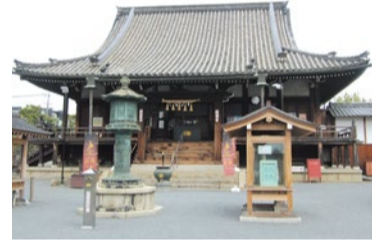
9世紀末、中納言藤原山隆創建と伝わり、本尊の秘仏・千手観音は、長谷観音の化身である童子がつくったとの伝説がある。

「1300年つづく日本の終活の旅～西国三十三所観音巡礼」が認定を受け、茨木市の西国二十二番総持寺も構成文化財のひとつとなった。総持寺は、西国巡礼で全国各地から多くの参拝客が訪れる寺。また総持寺には本堂をはじめ、