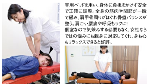
専用ベッドを用い、身体に負担をかけず安全で正確に調整。全身の筋肉や関節が一瞬で緩み、肩甲骨周りがほぐれ骨盤バランスが整う。肩こり・腰痛や呼吸もラクに! 個室なので気兼ねする必要もなく、女性ならではの悩みにも親身に対応してくれ、身も心もリラックスできると好評。

【六甲道】上部頸椎・骨盤矯正 すまいるカイロプラクティック 神戸市灘区森後町2-3-10 伊達ビル1階 営業/10時~14時、16時半~19時(土曜10時~17時) 火・日曜・祝日定休 要予約 HPより24時間予約可 ※休み/6/7・13・21・27・7/5・8・11・19・24 ☎078-843-3318 http://smile-chiropractic.com/ すまいるカイロ 整体 灘区 で検索