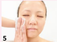
5 オリジナルの化粧品で保湿。肌質が変わった実感とともに、潤い肌の小顔美人が完成!