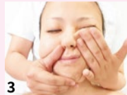
3 圧を加えて、溜した脂肪や老廃物をリンパに流す。「イタ気持ちいい」感覚があるほど、脂肪や老廃物が溜まっているそう。一回り小さくなったフェイスラインに感謝!

特典 「シティライフを見た」で 造顔マッサージ®体験 初回限定 60分コース …9,720円 → 4,860円 (シティライフ限定価格) ※造顔マッサージ®とはオールハンドで行う 「小顔トリートメント」のことです。(商標登録取得済) ※カード支払可 (要予約・新規の方のみ・6月末まで)