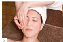
1. 明るく潤いのある肌へ導いてくれる「ホワイトニングパック」 2. フェイスラインがすっきり! 引き上げ効果抜群の「エイジングケア」10分 1,080円も大人気。

特典 「シティライフを見た」で、 ●(イルネージュ使用・ビジー価格) スタンダードコース(50分)6,480円+ホワイトニングパック(20分)2,160円をセットで..... 4,320円 (7月末まで・完全予約制)