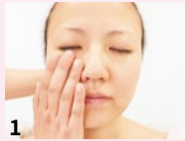
1 施術効果上げるため、クレンジングで汚れを落とし、肌をリセット。

顔の筋肉は、ストレスや首・肩のコリ、噛みグセなどで硬くなり、血流やリンパが滞って、たるみやむくみの原因に。「造顔」の正規継承サロンである当店では、数種類のハンドマッサージによりイタ気持ちいい圧を加え、老廃物を静脈やリンパに流し込みます。肩や首のコリもスッキリ! 羨ましがられる小顔美人を目指して、ぜひご体験ください。