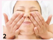
2 座って行うことで、血流やリンパの流れが3倍アップ! 溜まった脂肪や老廃物がほうれい線の原因だとか。