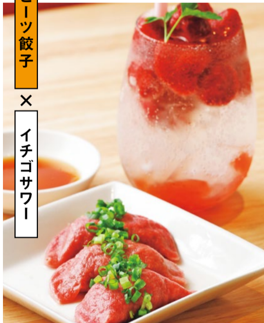
スーパーフード・ビーツを皮に練り込んだ、見た目にも鮮やかなビーツ餃子(378円)。一緒に注文したいのが、甘さ控えめのイチゴサワー。常連客の間では“追い”サワーをするのが定番(648円)。