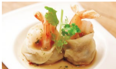
〈上〉バルサミコのオリジナルソースを添えたフォアグラ丸餃子(680円・2個)。美味しさを追求した一品。〈下〉プリプリの海老をのせ自家製パクチーのタレをトッピングした、神戸丸餃子丸ごと海老(380円・2個)。※すべて税別