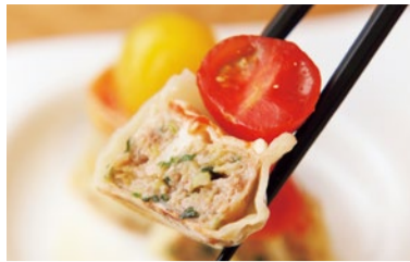
モチっとした皮に国産の豚肉、ニラ、生姜など素材にもこだわる。あっさりとい何個でも食べられる美味しさ。