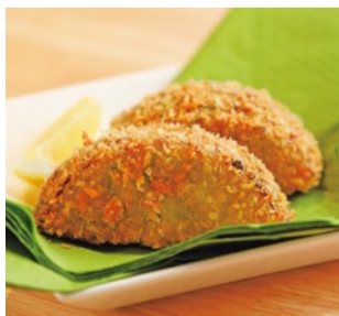
たっぷりのキャベツの甘味、シャキシャキの歯ごたえがたまらない餃子ロッケ(410円)。特に男性客からの人気が高い、オリジナルメニュー。カリッと揚がり、お酒が進むこと間違いなし(410円)。女性向けにちび餃子ロッケもあり。