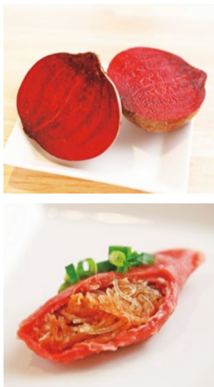
〈上〉飲む輪血と言われるほど、栄養価が高く美容にいいとされるビーツ。〈下〉モチモチでつるんとした食感が特徴。タネにはたっぷりの春雨が入って、とってもヘルシー。干しむきエビが贅沢に使われ、食べた瞬間に香りと旨みを感じる。大きめサイズで食べ応えあり。