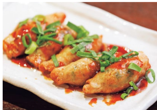
〈上〉皮に焼き色がつく直前のタイミングでチーズを入れて外はパリパリ、中はトロトロに仕上げる(600円)。ピンク岩塩のアクセントが効いた「塩レモンシャーベットサワー(500円)」の酸味と甘じょっぱさがベストマッチ 〈下〉鶏皮で餃子の餡を包み揚げる鶏皮ギョーザ(500円)。甘辛いタレにジュワッとジューシーな脂が絡まる逸品。※すべて税別