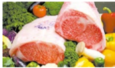
シティライフ限定コースはランチでもディナーでもオーダーOK。

神戸牛で定評のある「モーリヤ」グループのカジュアルレストラン。今回は、神戸牛を使用した絶品ステーキを気軽に味わえるシティライフ限定コースが登場！ソファ席があるので、ファミリーや各種集まりにもオススメ。他にも、ビーフシチューをはじめとした神戸ビーフを堪能できるメニューが多数そろっている。