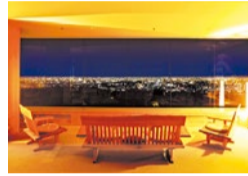
(上)花会席の一例。旬の味覚をいっばいに、素材の旨みを引き立てた品々。 (左)夜は大阪平野が一望できる夜景が楽しめる。

箕面の自然と大阪の街並が一望できる風の杜は、お料理目当てで宿泊する人が多いほど会席が評判。5/29~7/4限定で、4,500円の花会席付き1名様10,000円~のお得な宿泊プランが登場。ゆったり過ごしたい人には部屋食がおすすめ。この機会に父の日や記念日にご両親を誘ってはいかが。