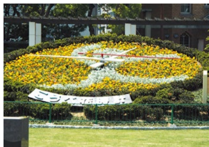
5/9に行われた植替えは神戸まつりのデザイン。メインテーマは「緑と海を愛して」。

1957年の誕生以来、神戸のシンボルとして親しまれてきた「こうべ花時計」の移設工事が完了。3月28日に再始動セレモニーが行われた。神戸市中央区の神戸市役所2号館北側にあったが、本庁舎再整備に伴い昨年11月に停止。この日、元の場所から500メートル南側の東遊園地内に暫定移設された。