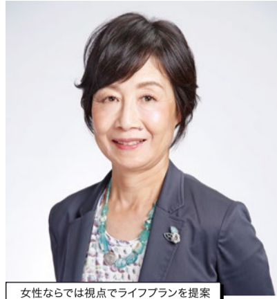
女性ならではの視点でライフプランを提案