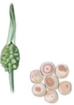
【カラスビシヤク / Pinellia ternata】

は制吐、消化機能促進に使われる薬味と考えられ、その役目は組み合わせにより変わります。繁用されている処方例では六君子湯(半夏・生姜・茯苓・白朮・陳皮・人参・大枣・甘草)からなる処方