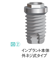
図② インプラント本体 外ネジ式タイプ