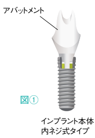
図① インプラント本体 内ネジ式タイプ

歯周病・虫歯・事故な どで歯を失ってしまった 場合の治療の一つとして 「インプラント治療」が あります。入れ歯やブ リッジなどの治療法も ありますが、インプラ ントはより自然な見た目 と噛み心地が得られる ことから選ばれる方が 多く、今ではごく一般 的な治療法になったと 言えます。インプラ ントは、日本で行われ るようになってから約 40年が経過しており、 私自身30年以上イン プラント治療に携わっ ています。インプラ ント本体は、多くの メーカーから出され ていますが、新しいと さ