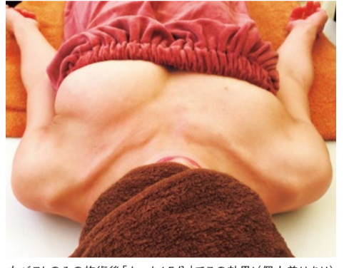
左バストのみの施術後「たった15分」でこの効果!(個人差はあり)バストトップを出さないで抵抗が少ない施術。

このメニュー、この技が すごい 下垂バスト豊胸コース 人が持つ生体電流と同じ波形の電気「ナノカレント」が細胞を活性化させるという安全な施術。まずはベストを10分ほど着用し、バストと背中のコリ固まった血流を改善。 次に電流が流れるグローブで理想のバストを形成。流れた脂肪を本来あるべき位置に形状記憶させ、ふっくら美しいバストをつくる。