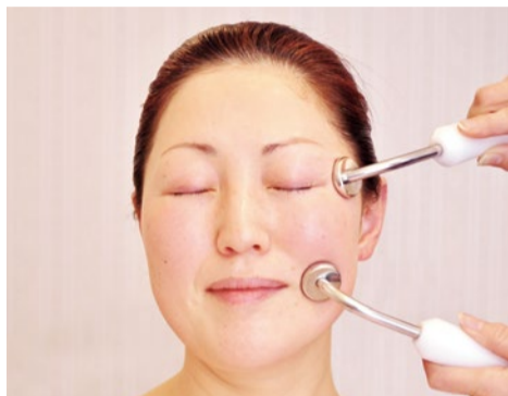
「ほうれい線、おでこのシワがない！」「あごのラインがシャープ！」。喜びの声多数。

このメニュー、この技が すごい リアルリフトフェイシャル 加齢と共に増える肌悩み改善はもちろん、顔印象がガラリと変わるリピーター続出メニュー。1回の効果が1ヶ月後の次回予約の時まで持続するというのが驚き！ワンランク上の結果を求める方に人気。