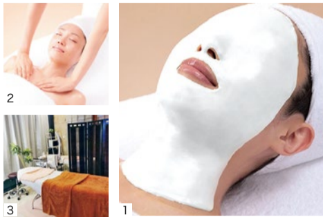
1.保湿効果も高く、肌本来の美しさへ。2.デコルテから顔全体を美肌マッサージ。3.ゆったりリラックスできる店内で心もリフレッシュ。

紫外線や乾燥でダメージを受けたら、オプションのバックホワイトメニューを試してみてください。ダメージ肌をしっかりケアし、顔も自然な明るさに。 ※バックホワイトは(医学部外品)メラニンの生成を抑え、シミ・ソバカスを防ぐ